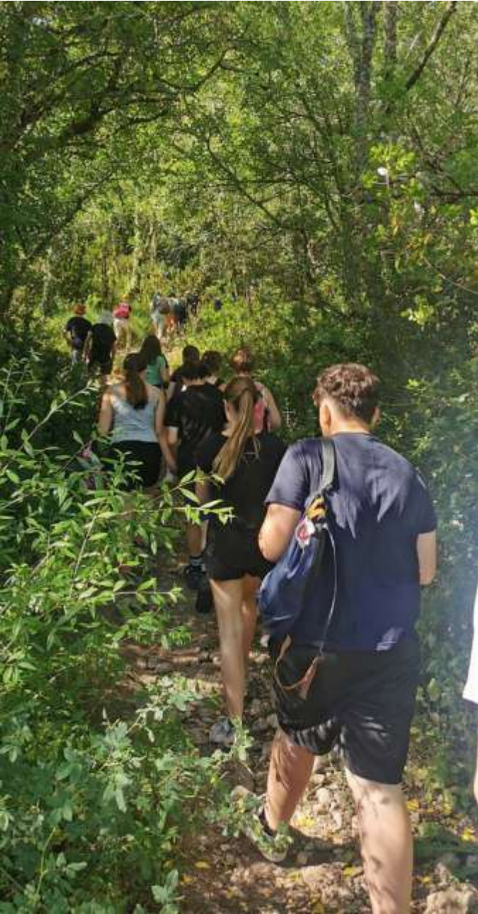
Marche (au soleil le moins possible)